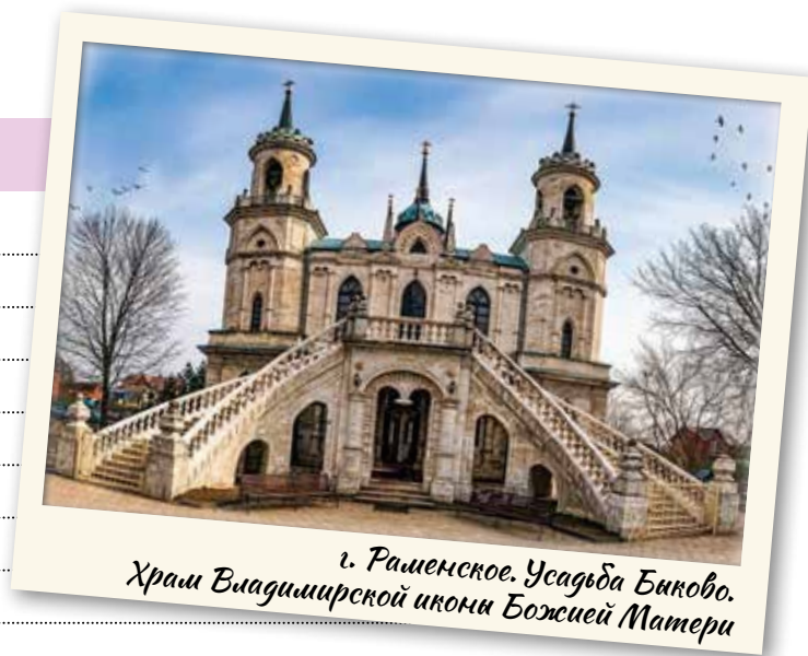
г. Раменское, Усадьба Бяково. Храм Владимирской иконы Божией Матери