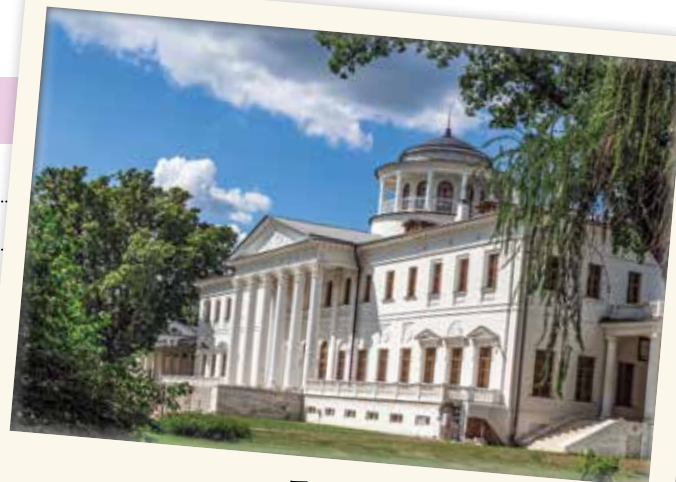
г. Подольск. Усадьба Остафьево