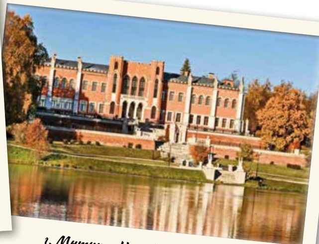
г. Митищи. Усадьба Марфино, вид с озера