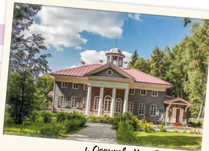
г. Одинцово. Усадьба Захарово. Дом-музей А.С. Пушкина