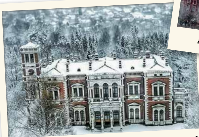
г. Рашемское. Усадьба Биково