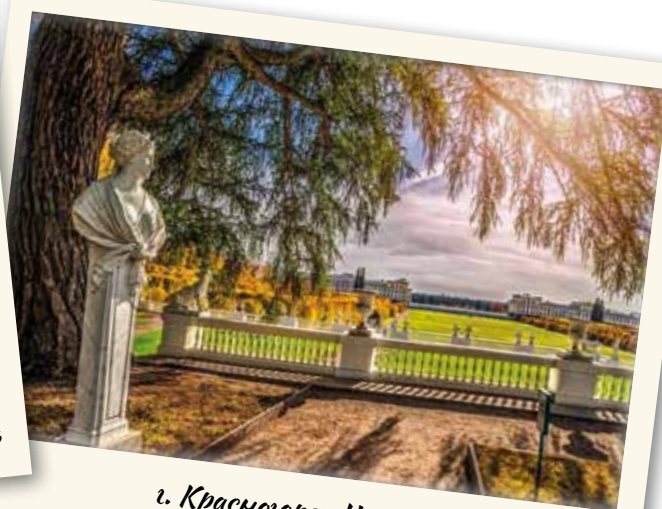
г. Красногорск. Усадьба Архангельское