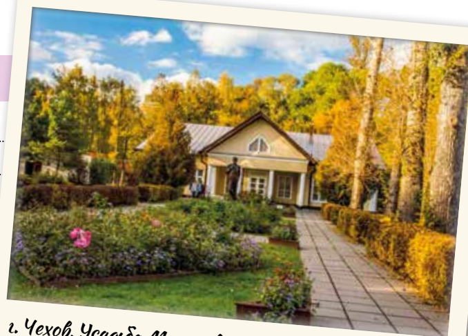
г. Чехов. Усадьба Мелихово. Дом-музей А.П. Чехова