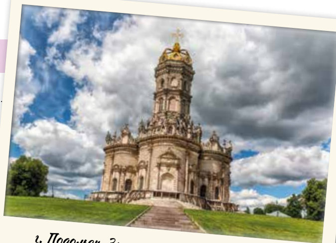
г. Подольск. Знаменская церковь в Дубровицах