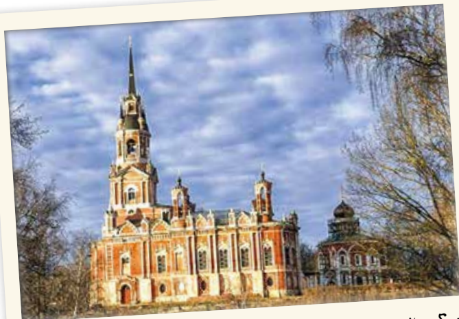
г. Можайск. Ново-Никольский собор