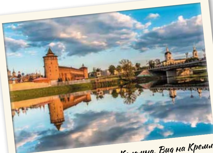
г. Коломна. Вид на Кремль