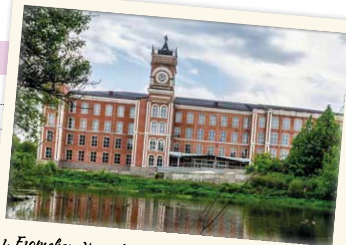
г. Егорьевск. Худовская бумагопрядильная фабрика