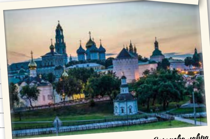
г. Сергиев Посад. Свято-Троицкая Сергиева лавра