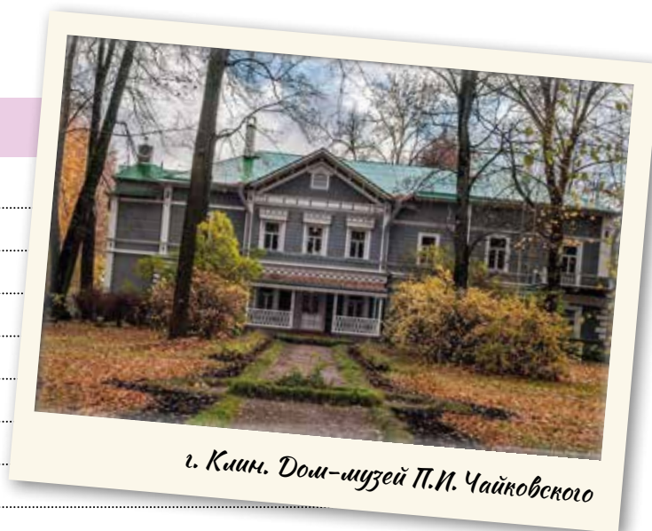
г. Клин. Дом-музей П.И. Чайковского