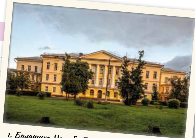
г. Балашиха. Усадьба Горенки графа Разумовского