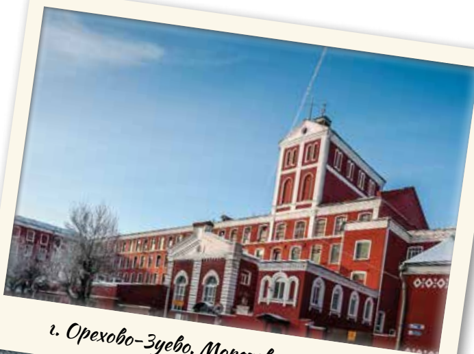
г. Орехово-Зуево. Морозовская мануфактура